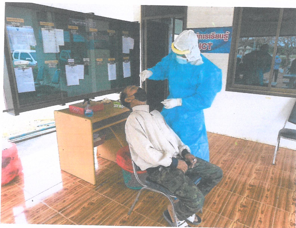
ภาพถ่ายการตรวจ ATK (Antigen test kit) บุคลากรในองค์การบริหารส่วนตำบลระเว วันที่ ๒๑ เดือนกุมภาพันธ์ พ.ศ. ๒๕๖๕