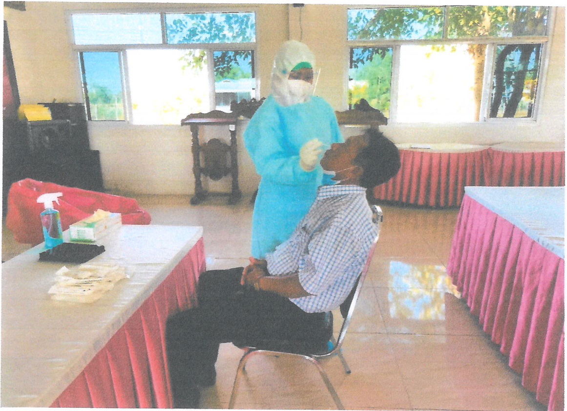
ภาพถ่ายการตรวจ ATK (Antigen test kit) บุคลากรในองค์การบริหารส่วนตำบลระเว