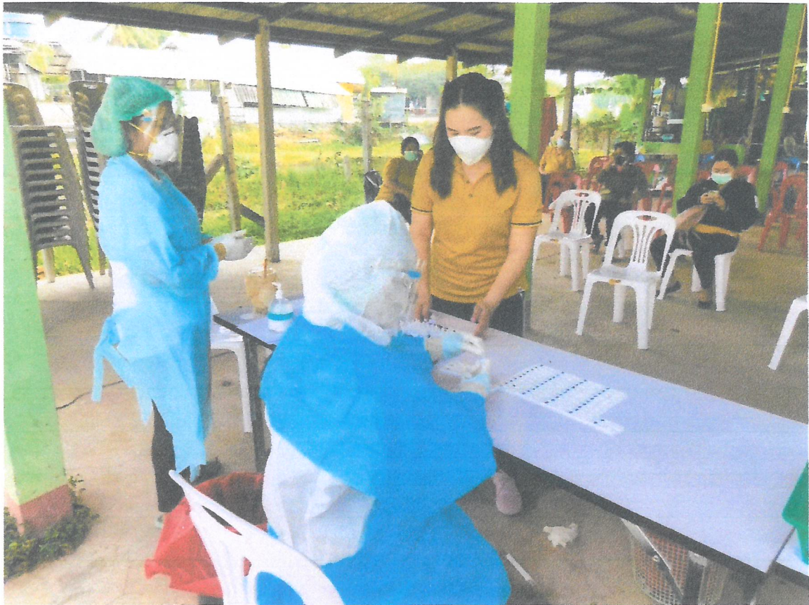
ภาพถ่ายการตรวจ ATK (Antigen test kit) บุคลากรในองค์การบริหารส่วนตำบลระเว