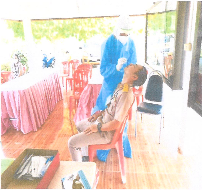
ภาพถ่ายการตรวจ ATK (Antigen test kit) บุคลากรในองค์การบริหารส่วนตำบลระเว